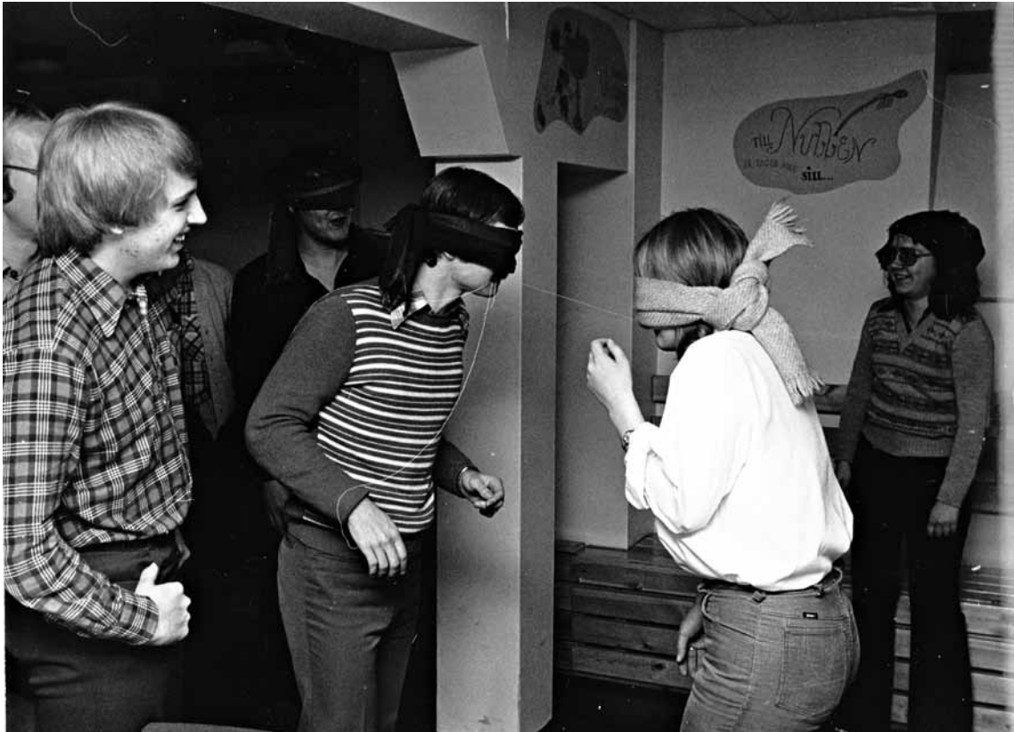
Ylioppilaskameroiden pikkujouluriehää 1970-luvulla.

miä. Helsingin Sanomien arvostelija piti näyttelyä vaisuna. Varsinainen vuosijuhla järjestettiin Savolaisessa osakunnassa, Uuden ylioppilastalon 6. kerroksessa. Ylioppilaslehdessä mainostettiin juhlaa lakonisesti: "Liput 8 mk. Ja kaikki mukaan". Ohjelman mainittiin olevan monimuotoista ja runsasta. Illan tähtiesiintyjät olivat Heinäsiirikka ja Tavaramarkkinat .