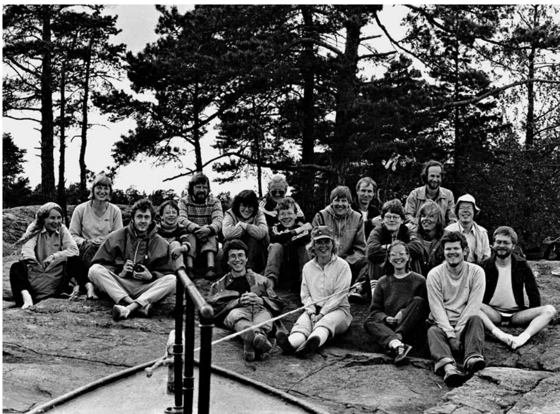
Ylioppilaskameroiden kuvausretki Upinniemeen vuonna 1982.

Merkittäväksi muodostui Vanhalla ylioppilastalolla järjestetty Ylioppilaskamerat 80 -näyttely, josta toivottiin jokavuotista ja aina edellistä laadukkaampaa tapahtumaa. Seuraavan vuoden näyttely järjestettiin naapurissa, Uuden ylioppilastalon Kirjakahvilassa. 20-vuotisjuhlanäyttely oli jälleen Vanhan Korporaatioalissa. Näyttelypalkinnoiksi saatiin yrityksiltä lahjoituksina kirjallisuutta ja fil-